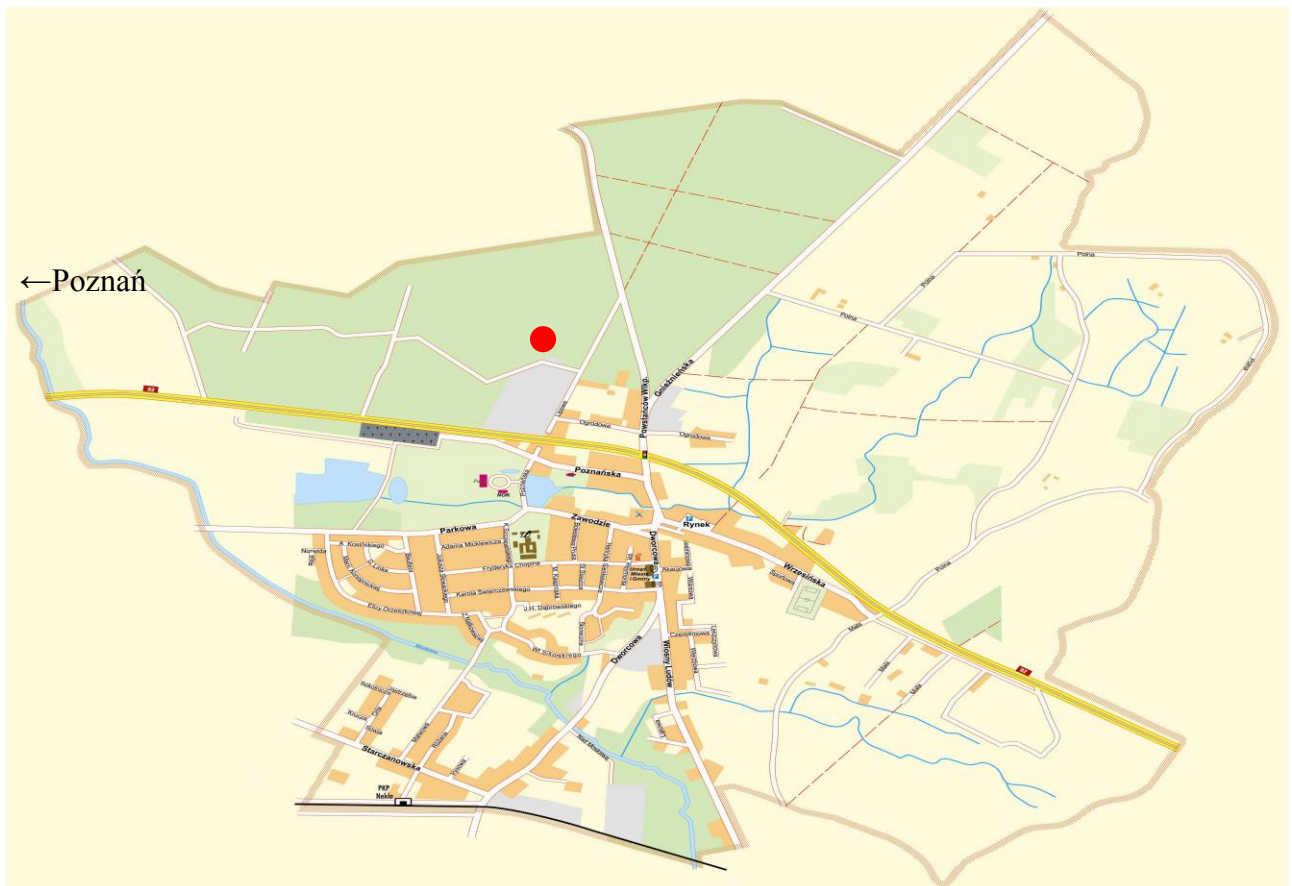
Mapa usytuowania strzelnicy.